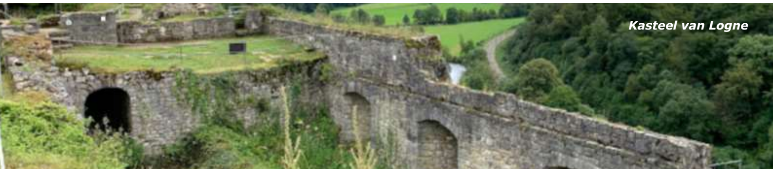
Kasteel van Logne

We starten de GR57 in Comblain-au-Pont, waar we met de clubreis in april zijn geëindigd. Na een korte koffie/thee- en toiletstop gaan we op pad.