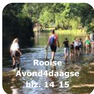
Rooise Avond4daagse blz. 14-15