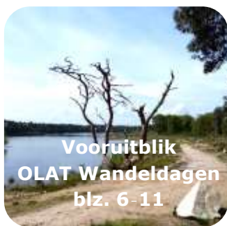
Vooruitblik OLAT Wandeldagen blz. 6-11