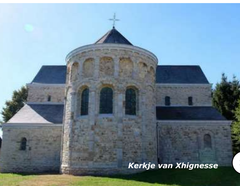
Kerkje van Xhignesse

-Commissie Clubreizen - (praktische informatie op blz. 24)