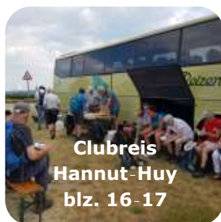
Clubreis Hannut-Huy blz. 16-17