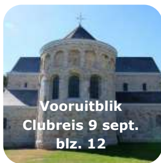
Vooruitblik Clubreis 9 sept. blz. 12